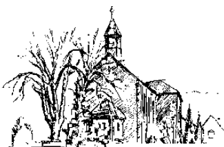
St. Franz von Sales, Kandern