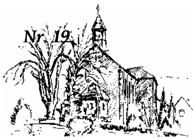
St. Franz von Sales, Kandern