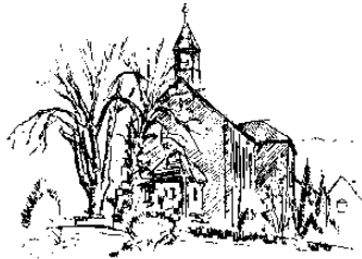
St. Franz von Sales, Kandern