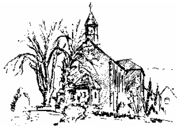
St. Franz von Sales, Kandern