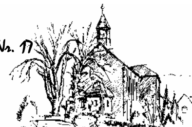
St. Franz von Sales, Kandern