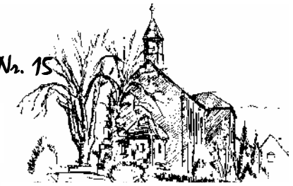
St. Franz von Sales, Kandern