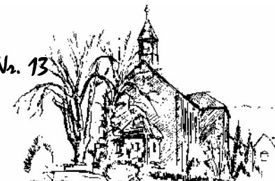
St. Franz von Sales, Kandern