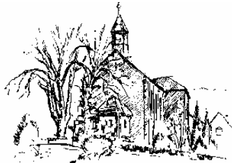
St. Franz von Sales, Kandern