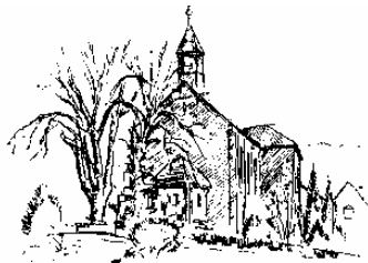
St. Franz von Sales, Kandern