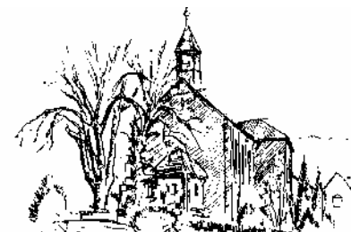
St. Franz von Sales, Kandern