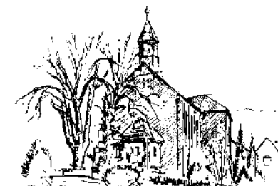
St. Franz von Sales, Kandern