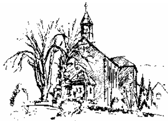
St. Franz von Sales, Kandern